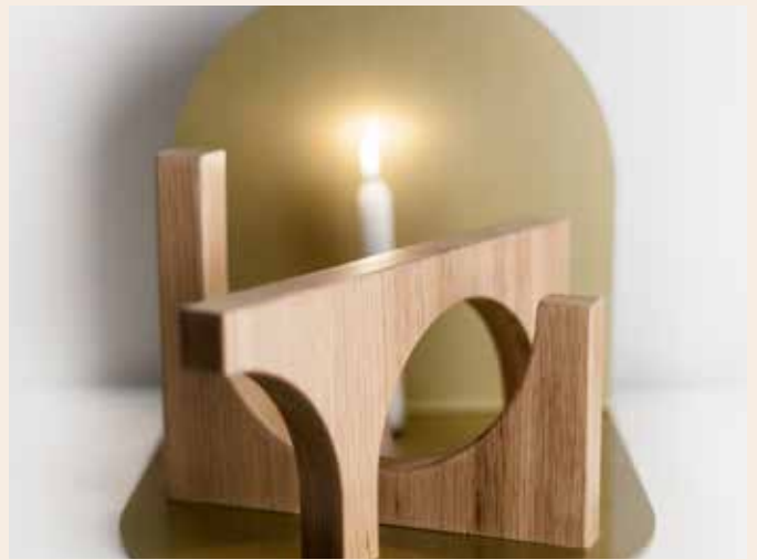
Suargia - projet Coming Home