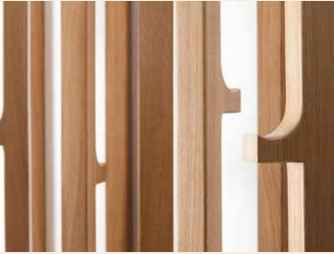
Bastoi-Basoa - projet Coming Home